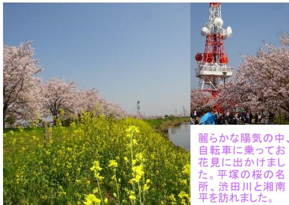
麗らかな陽気の中、自転車に乗ってお花見に出かけました。平塚の桜の名所、洪田川と湘南平を訪れました。

新年度を迎えて、この春から新しくパートなどを始められる方も多いのではないのでしょうか。半年以上の勤務期間があり、労働日数・時間などの条件を満たした場合、アルバイトやパート従業員も有給休暇を取る事ができます。 受給額については、シフト等で労働時間が決まっている場合は通常の賃金相当額が支給。また過去3カ月実績から平均を出す方法、健康保険の標準報酬日額で算出する方法もあります。