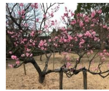
寒い日が続いておりますが、事務所近くの総合公園の桜は咲き始めています。