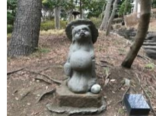
平塚市総合公園内の大吉 たぬきです♪